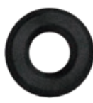
3.201.00 Kleberosette in Schwarzstahl-Optik*