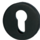
4.206.00 Innendrücker mit Rosette in Schwarzstahl-Optik*